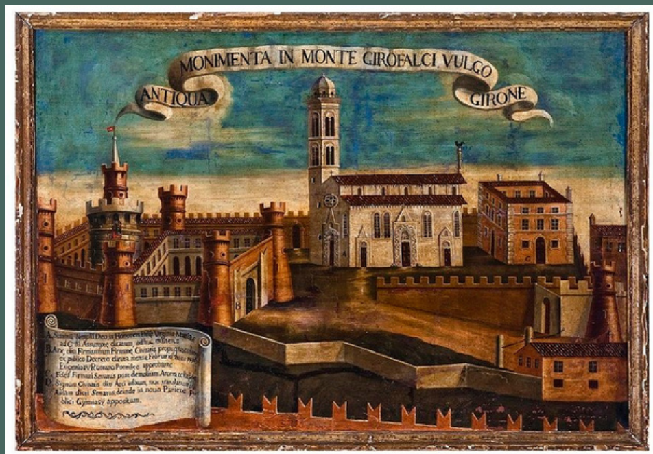
opera su tela: "Veduta di Fermo" dipinto conservato presso Palazzo dei Priori nella Pinacoteca Comunale di Fermo